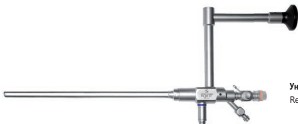
Универсальный гистероскоп прямого видения HEOS 12° Ref. 165 800 011